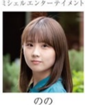
のの ミシェルエンターテイメント