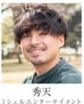
秀天 ミシェルエンターテイメント