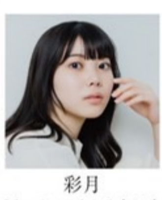
彩月 ミシェルエンターテイメント