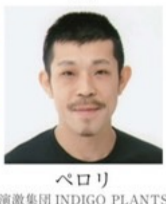
ペロリ 演劇集団 INDIGO PLANTS