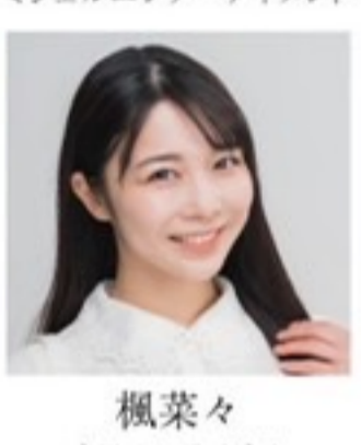
楓菜々 オフィスモノリス